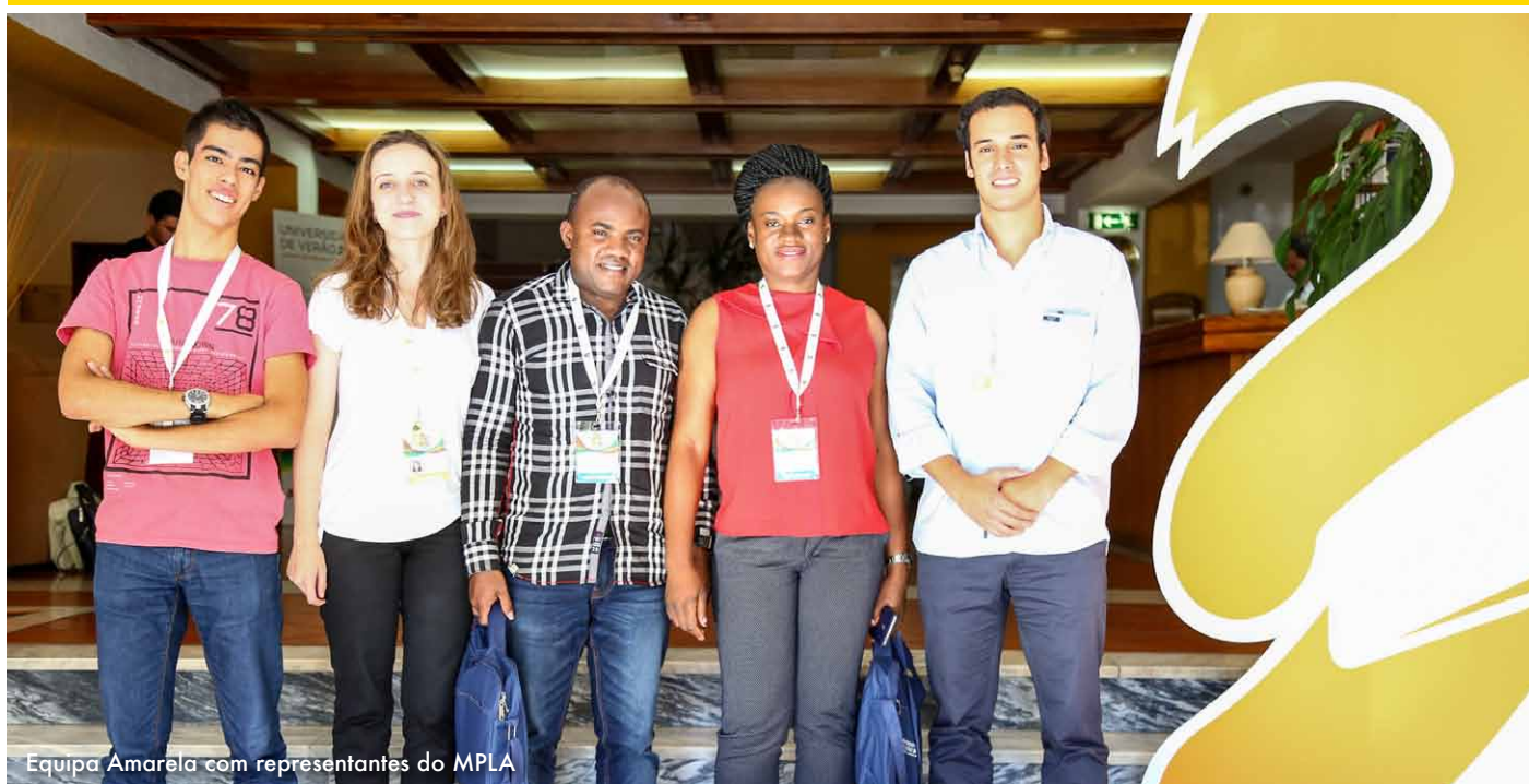
Equipa Amarela com representantes do MPLA

A VISÃO DOS REPRESENTANTES DO MPLA SOBRE A UNIVERSIDADE DE VERÃO