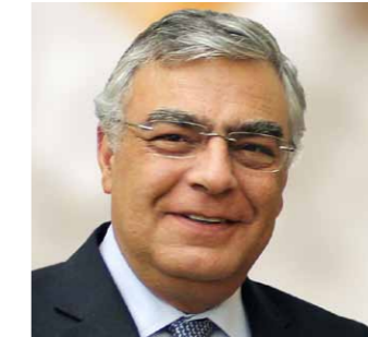
JOSÉ MATOS ROSA

Este é um ano particularmente exigente e em que todos somos chamados a ajudar a manter Portugal no rumo de rigor que vimos trilhando.